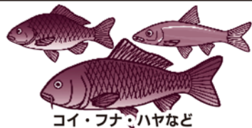
コイ・フナ・ハヤなど